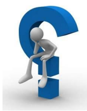
สมมุขไพร