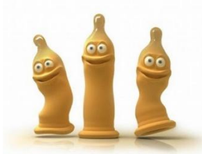
ถุขยงอนน้ามย

ถ้าท่านต้องการผลิตยามา 1 ชนิด เพื่อใช้รักษาอาการอยากมีแฟน โดยใช้ต้นทุนการผลิตต่ำสุดและต้องไม่มีใครเคยผลิตมาก่อน โดยมีส่วนประกอบที่ใช้ในการผลิตได้ ดังนี้