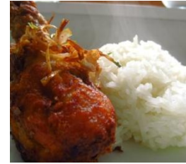
เหนียวไก่อ

และที่บ้านของท่านได้ปลูกสมมุขไพรไว้ ท่านจึงอยากใช้สมมุขไพรที่มีอยู่ให้เกิดประโยชน์