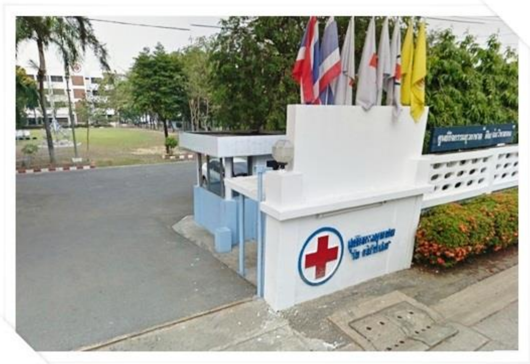
เข้ามาสูดซอกยก็ถึงค่ายแล้วจรัล