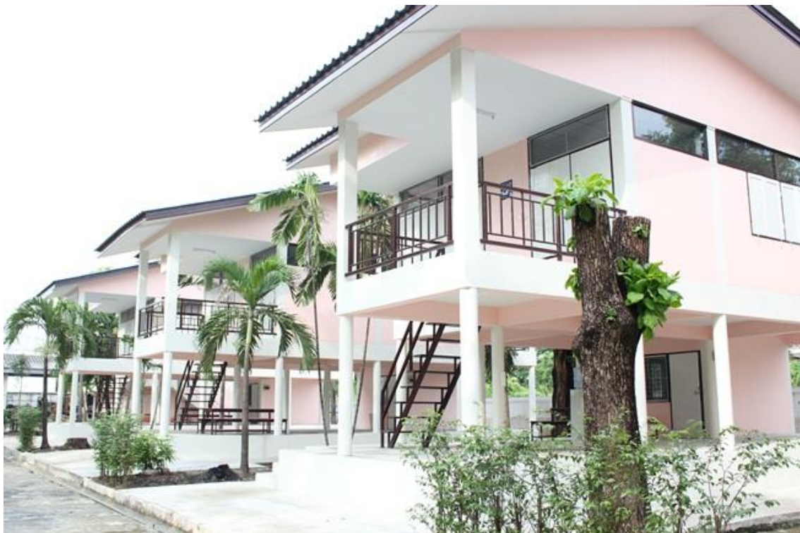
บรรยากาศบ้านพัก